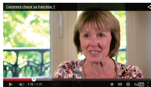
Vidéo « Comment choisir sa franchise ? »

Nous vous proposons de répondre à une série de questions qui vous permettront de faire une première évaluation de votre potentiel de créateur d'entreprise en franchise.