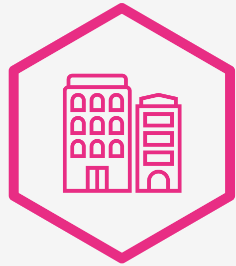
Dirigeants de PME