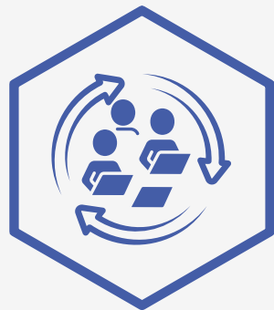
Clubs & Réseaux d'entrepreneurs