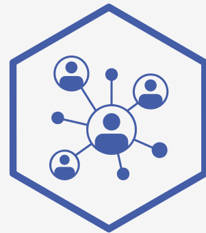
Espaces de coworking