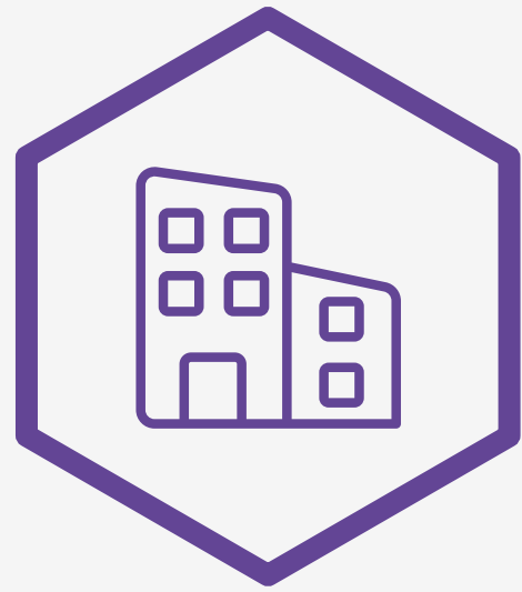
Dirigeants de TPE